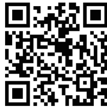
JGW日本福音書房への 地図